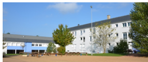
Site de 25 100 m 2 dont Bâtiments 8 905 m 2