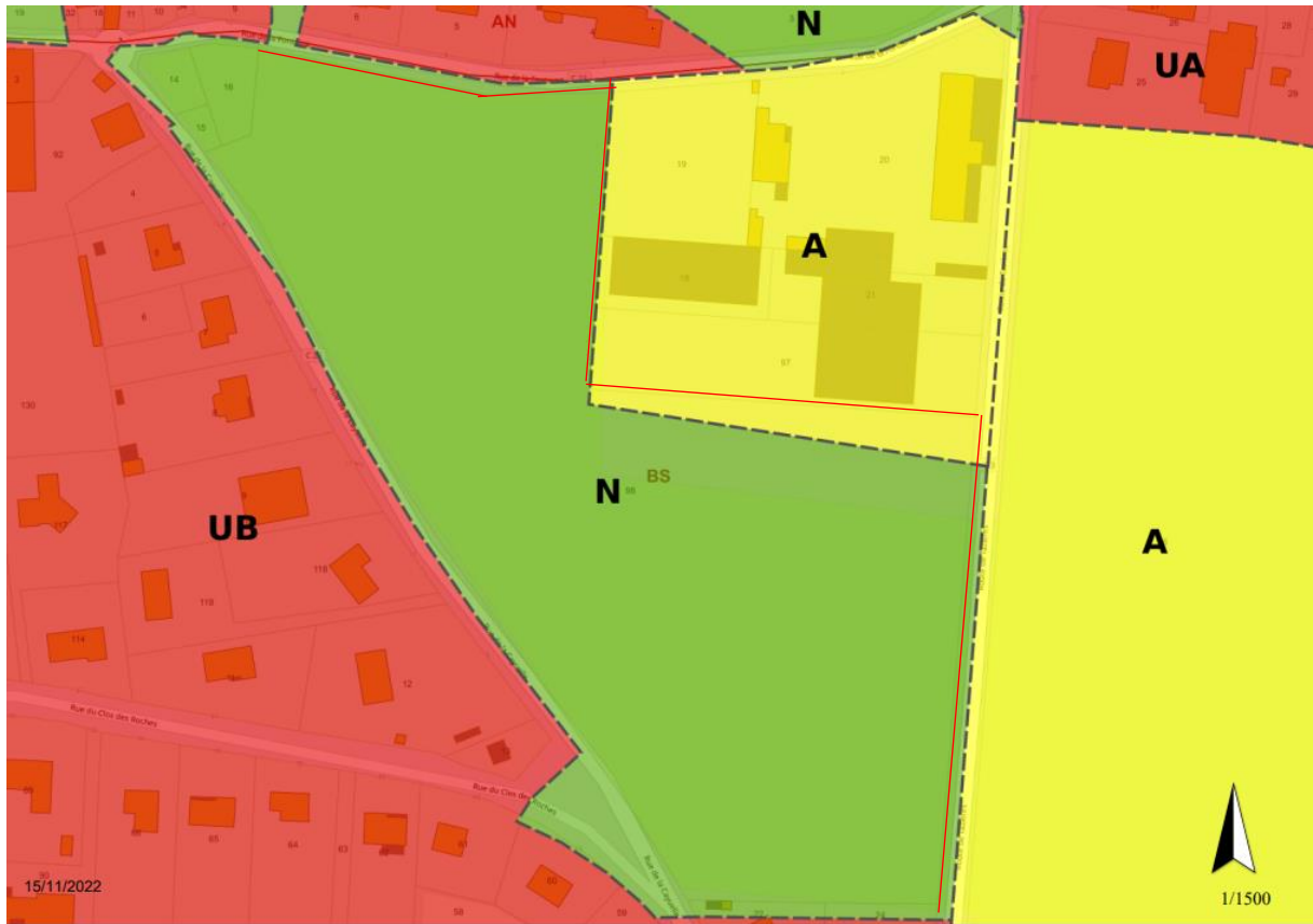
Zonage du PLU de 2007 : Délimitation de la parcelle BS 98