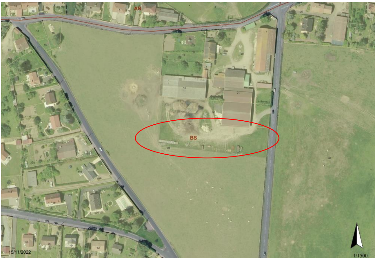
Photo aérienne : Situation de l'EARL de Tazières et secteur concerné par la modification

Cette procédure permettait à l'EARL de Tazières de construire un hangar agricole à usage de stockage avec toiture photovoltaïque pour son exploitation. En effet, la parcelle BS 98 sur laquelle M. LYON aimerait installer son hangar est classée en Zone N.