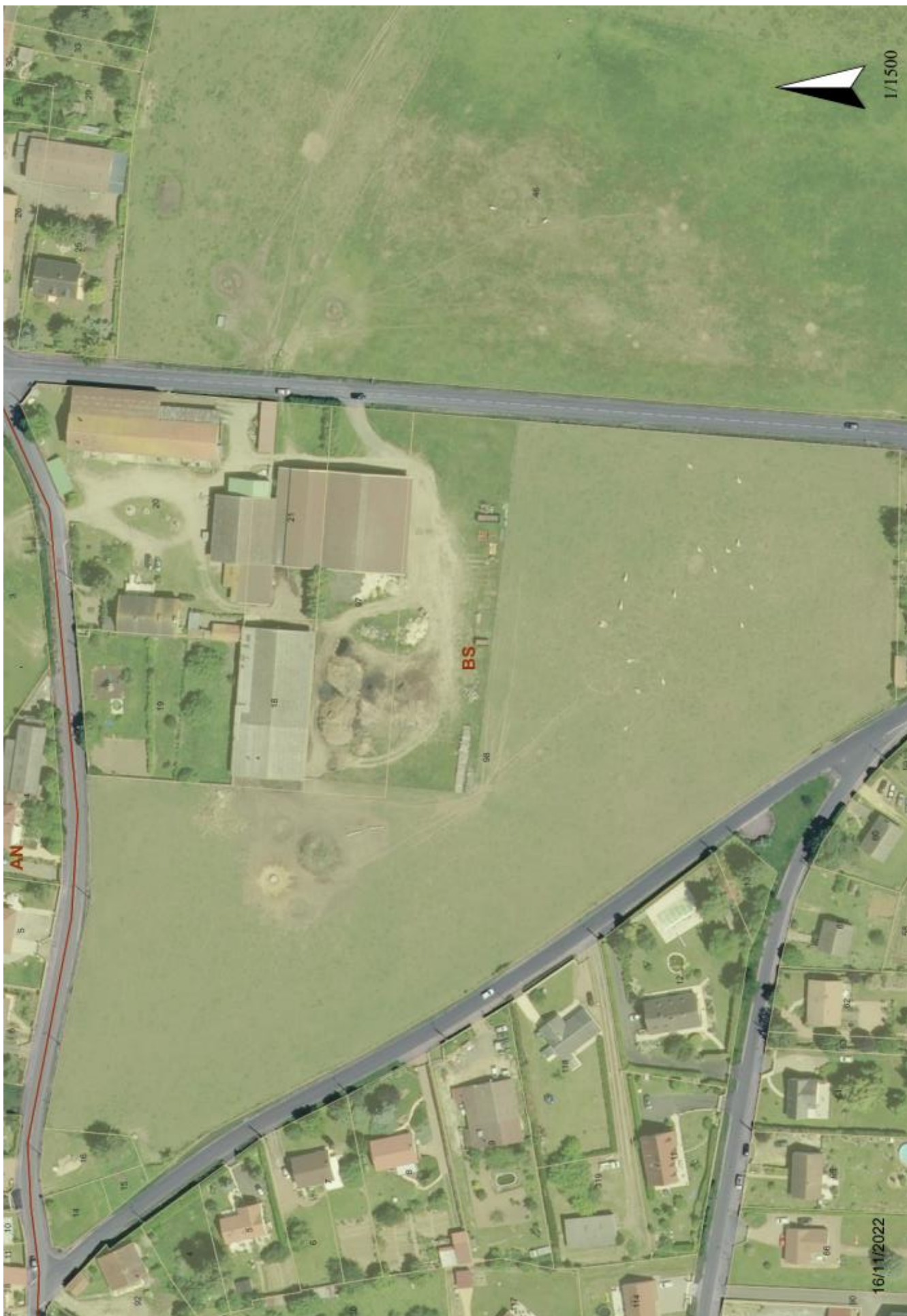
Plan de zonage PLU 2007