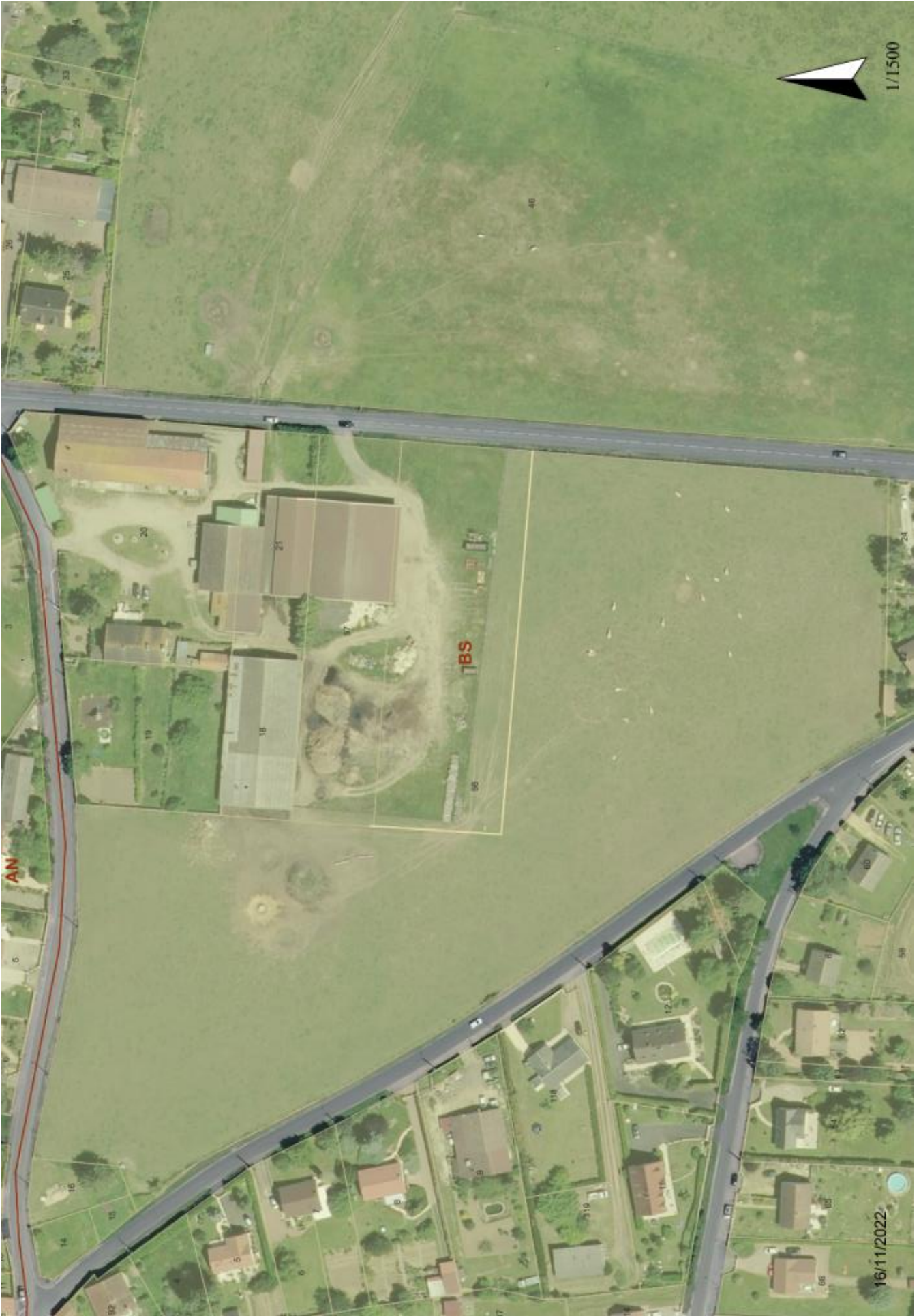
Plan de zonage modifié